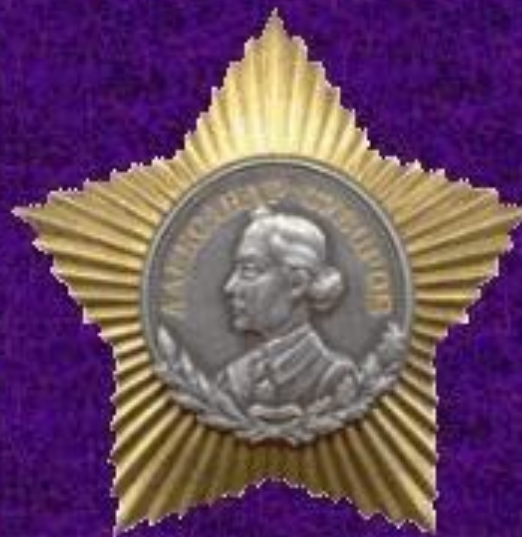
Орден Суворова II степени