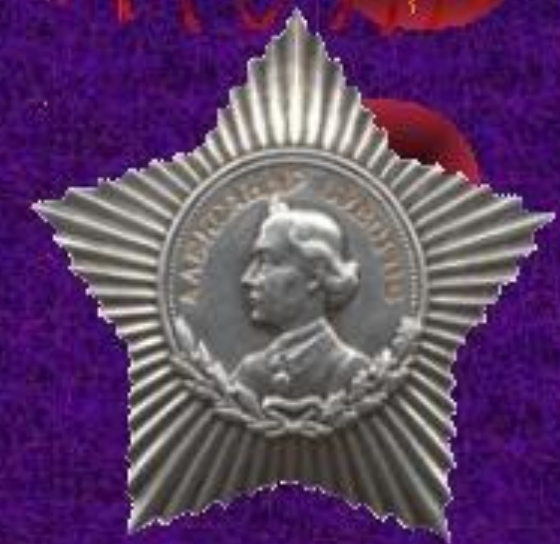
Орден Суворова III степени