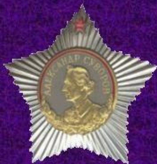
Орден Суворова I степени