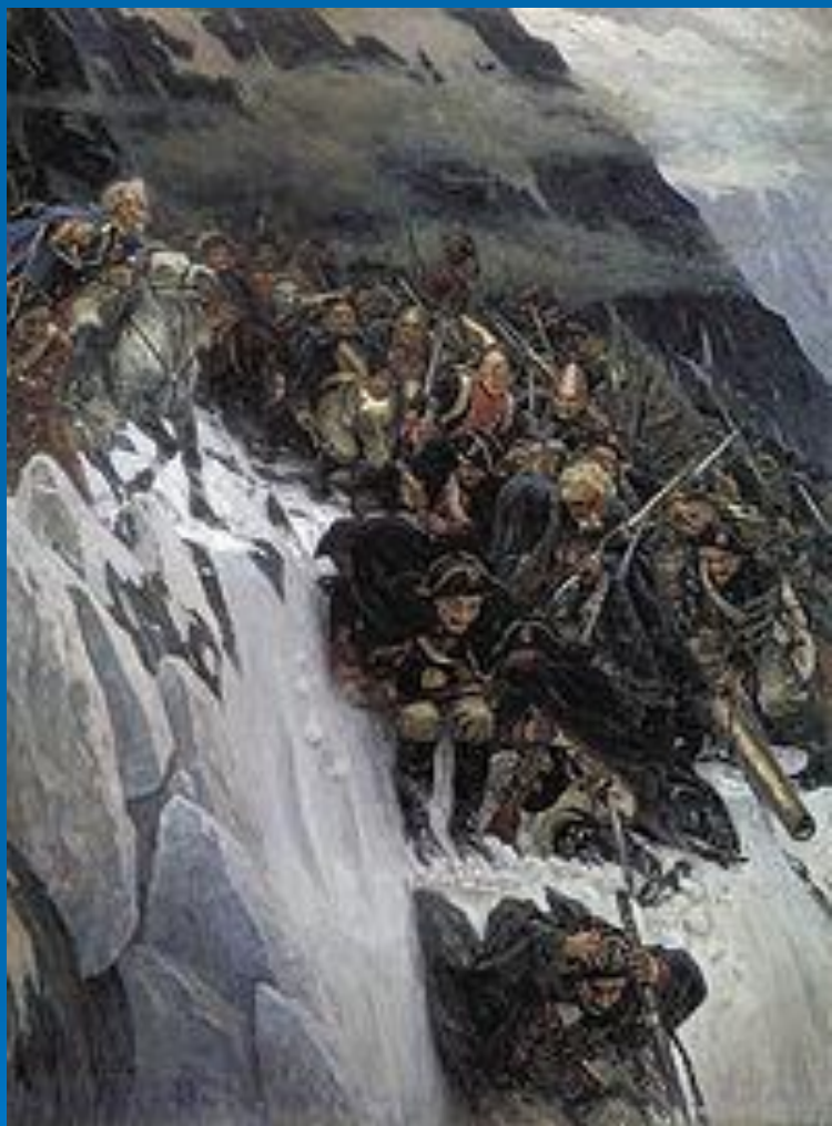
Суриков В. И. «Переход Суворова через Альпы в 1799 году»

Русская армия прорвалась через французские позиции, разгромив 15 тыс. группировку под командованием Массены. Двинулась на соединение с корпусом Римского – Корсакова.