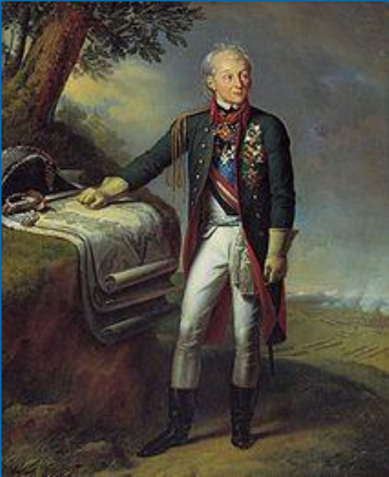
«Портрет А. В. Суворова». Художник К. Штейбен, 1815

Александр Васильевич Суворов (1729 – 1800г.) - полководец, не потерпевший ни одного поражения в своей военной карьере, один из основоположников русского военного искусства.