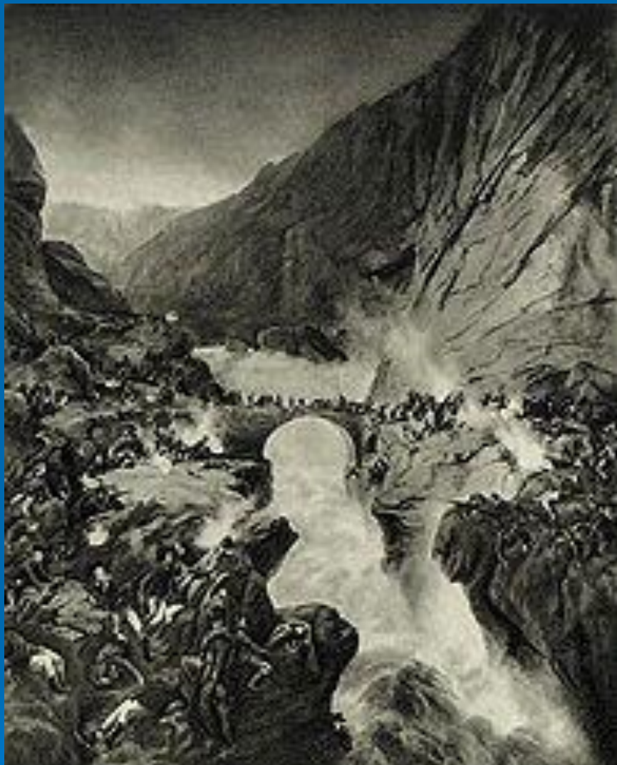
Переход Суворова через Чёртов мост. Художник А.Е. Коцебу.

Не обходимо было штурмовать мост, который был перекинут через ущелье реки Рейс.