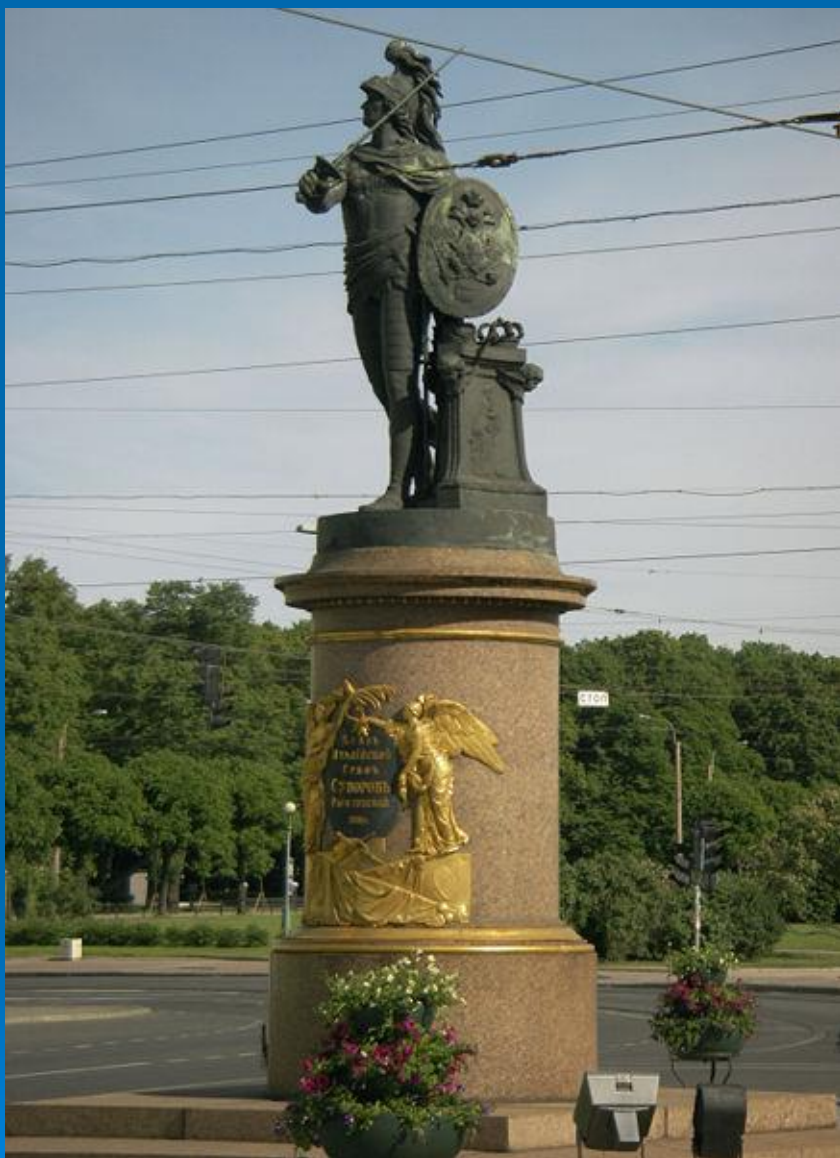
Памятник А. В. Суворову в СПб. М. Козловский

Суворов, однажды, сказал окружавшим его : "Я вам себя раскрою: меня хвалили цари, любили воины, друзья мне удивлялись, ненавистники меня поносили, при Дворе надо мною смеялись. Я бывал при Дворе, но не придворным, а Эзопом, Лафонтеном: шутками и звериным языком говорил правду. Подобно шуту Балакиреву, который был при Петре I и благодетельствовал России, кривлялся я и корчился. Я пел петухом, пробуждал сонливых, утомлял буйных врагов Отечества. Если бы я был Кесарь, то старался бы иметь всю благородную гордость души его; но всегда чуждался бы его пороков.