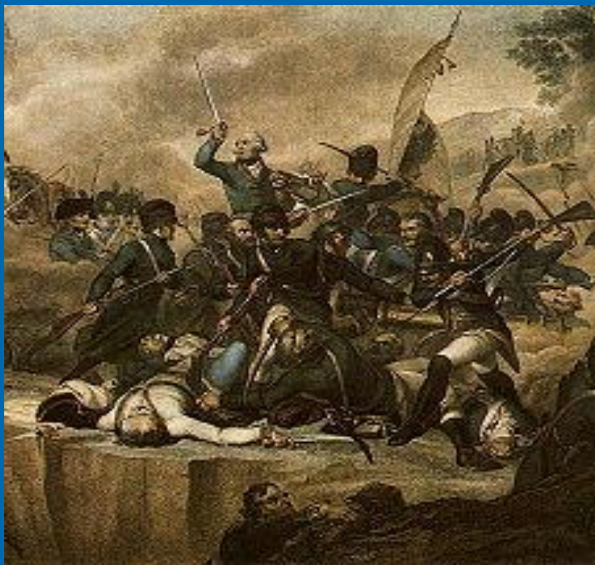
Сражение на р.Адда. Художник Спиаветти.