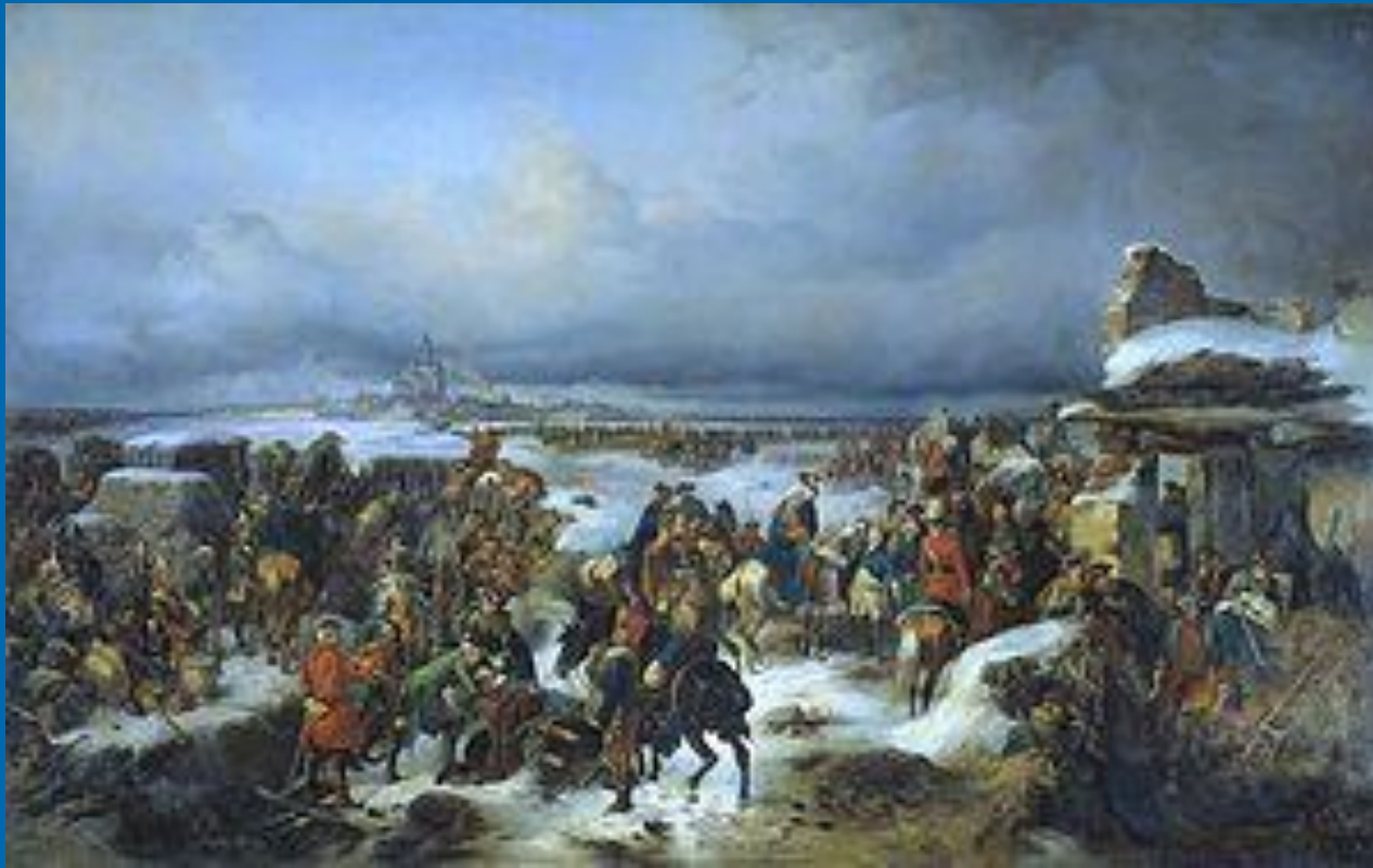
«Взятие крепости Кольберг в ходе Семилетней войны». А. Коцебу. 1852 г.

На картине изображено взятие крепости русскими войсками в 1761 г. Александр Васильевич командовал отдельными отрядами, которые прикрывали отход русских войск в Бреславлю. Во время многочисленных стычек проявил себя как талантливый и смелый партизан и кавалерист.