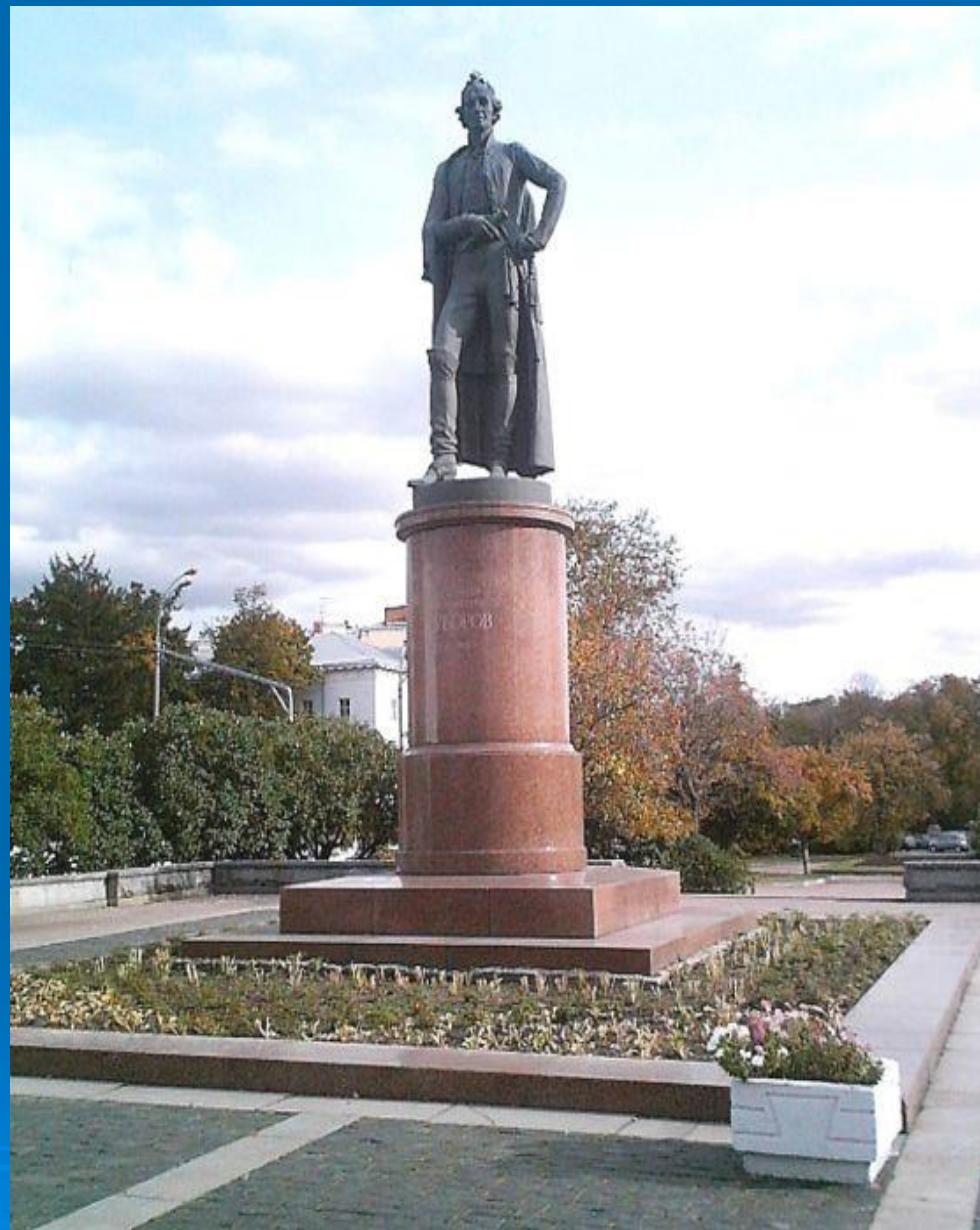
Памятник А. В. Суворову в Москве

"Суворов, - передал нам генерал Дерфельден - пробежал обширное поле Истории всех веков; со вниманием читал, слушал биографии великих мужей, хвалил примеры их величия; но для своей славы, проложил новую, дотоль неизвестную тропу. Он начал играть роль, ни от кого не заимствованную, а самим им для себя сотворенную и выдержал ее во всех превратностях долговременной жизни: был героем и казался чудаком".